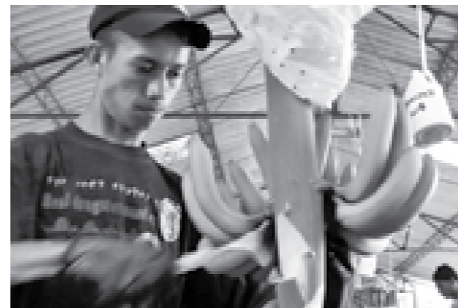
Los Bananeros, Alta Definición, imagen fija, 2009

Pared Oeste – ~ 9 minutos y se repite, banda sonora sincronizada. Video clips alternados del equipo de embalaje de la plantación en Ciénaga, Colombia. Altamente formal, este video sigue el proceso de los bananos recién cosechados de su racimo de 90 libras hasta quedar perfectamente empacados en cajas de cuatro a seis bananos, listos para exportar. El video es rítmico y fascinante, capturando la intensidad del trabajo manual y las funciones especializadas. El observador es llevado hipnóticamente a la labor que hay detrás de los sencillos bananos empacados, que cada día son reabastecidos en los supermercados alrededor del mundo durante todo el año.