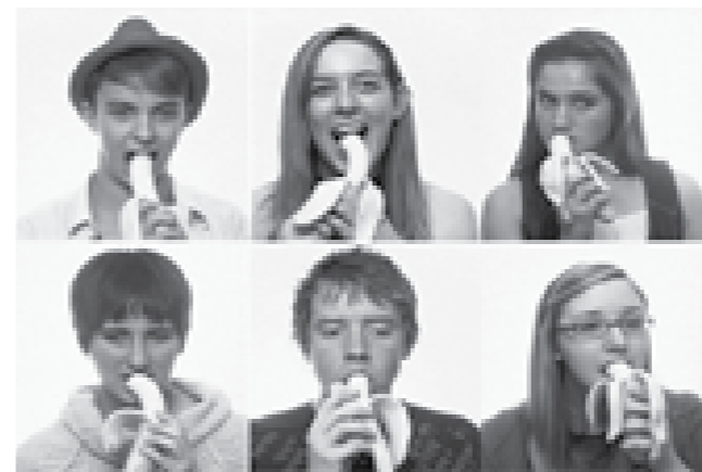
Imágenes fijas de adolescente de San Diego, California del video Banana Machine.

Pared Oeste – ~ 20 minutos y se repite, sin SONIDO. Video clips alternados de adolescentes comiendo bananos permanentemente. Los adolescentes son procedentes de San Diego, California y Cali, Colombia. El consumo hipnótico y perenne de bananos complementa el proceso del trabajo bananero cuando se ilustra el proceso de consumo. La simplicidad de este video enfatiza el placer, mostrando el mercado objetivo de adolescentes, quienes son escogidos, además, porque hacen resonancia tanto a la sensualidad de la fruta y a lo simbólico de la madurez, equiparado con la transición de la juventud a la madurez.